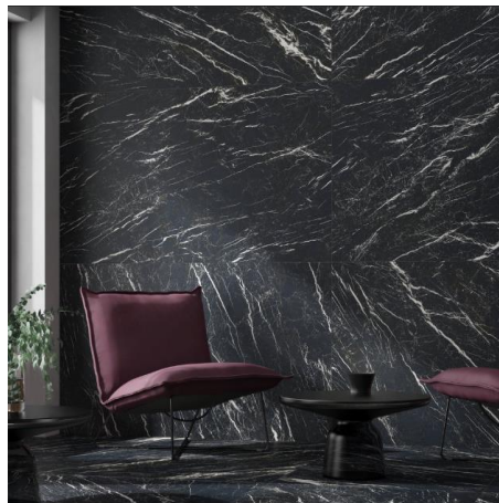
Deep 4D. Museum. Peronda