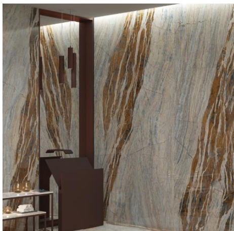
Ocean blue. Apavisa.

En lo relativo a la propuesta tonal, la tendencia concentra su propuesta en la escala baja, con fuerte presencia del negro . En este sentido el navy es uno de los colores destacados de la temporada.