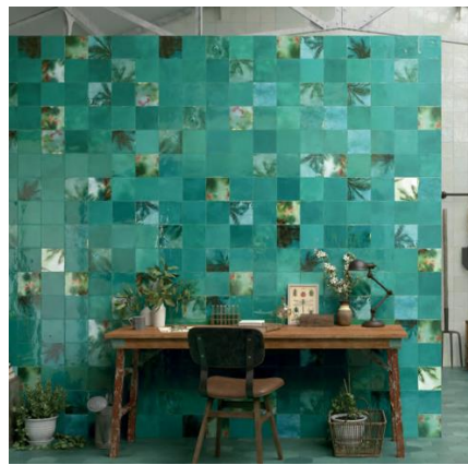
Souk kashba Nomade. Carmen