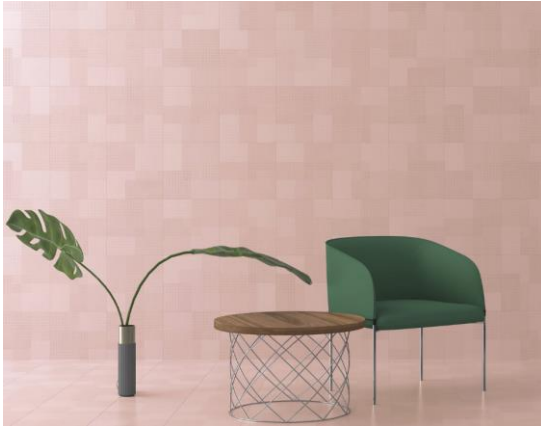
Textile. Yonoh. Harmony