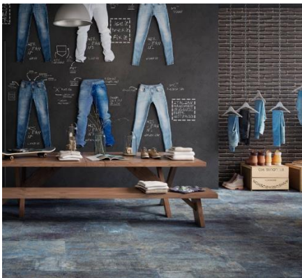
Alchemy 7.0.. Apavisa