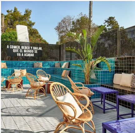
Restaurante Toro, Ibiza. Masquespacio

El color es esencial para entender esta tendencia. Destacan los tonos propios del mundo digital, azules, rosas y morados, pasando por las iridiscencias propias del entorno de las pantallas. Se desarrollan colores alejados de la tradición cerámica, gracias a las innovaciones en tintas y esmaltes. Destacan los colores intensos y vivos, pero no solo en una gama de colores primarios puros, sino versiones más sofisticadas de esta paleta relacionada con el mundo infantil.