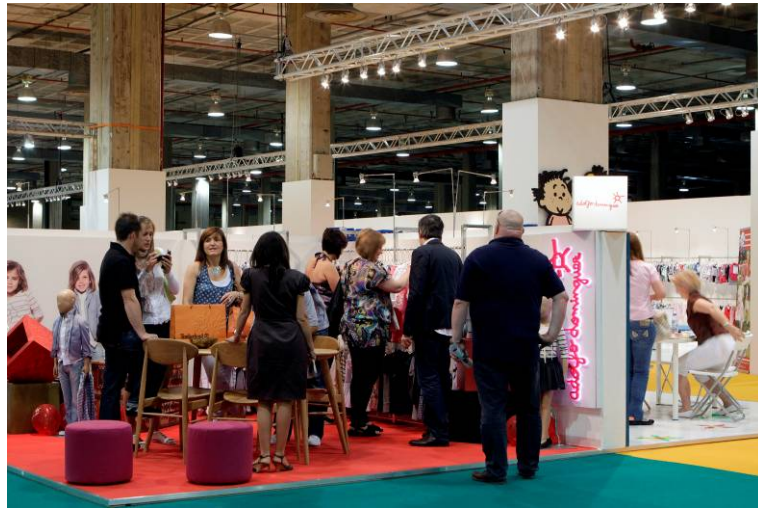
PACK FIMI PERSONALIZADO 16 m 2 esquina